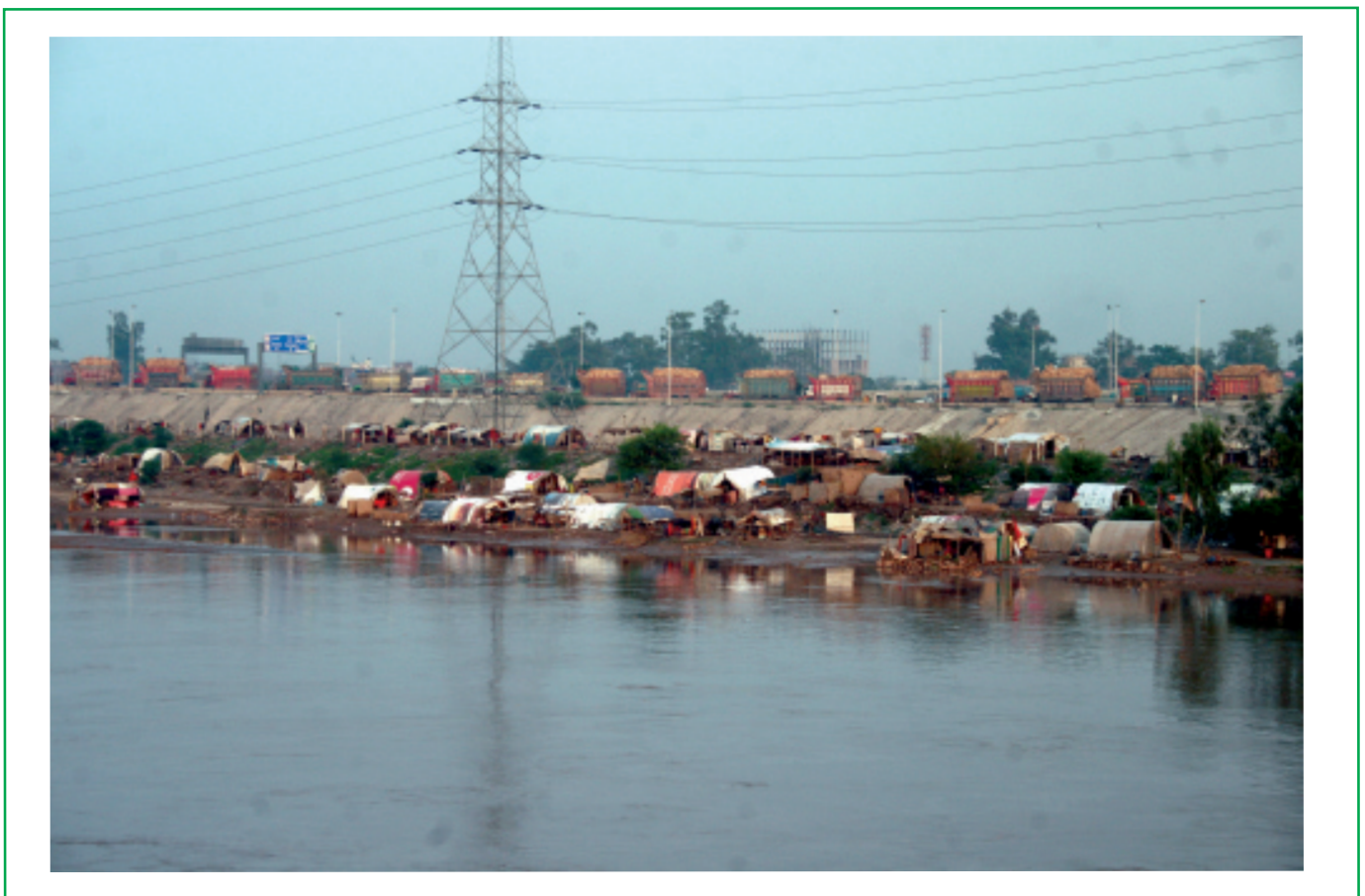
Improvisados campos de desplazados, visitados por Channan, junto a los ríos crecidos tras las lluvias monzónicas del verano.