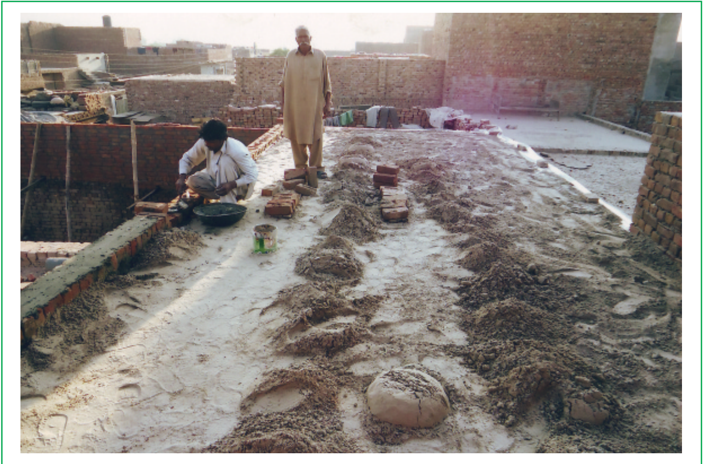
Tareas de construcción de casas.