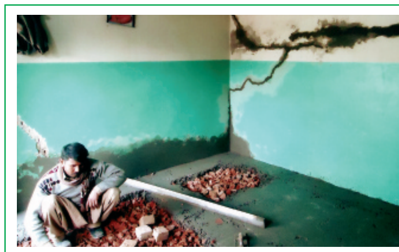
Reparación de casas.

46.188 euros fueron enviados a comienzos de 2011. Con ellos se han construido 5 casas en Khuspur: también se han hecho reparaciones en la Casa del Laicado Dominicano. A 55 agricultores de esta ciudad se les proporcionó además fertilizante para poder recomenzar sus tareas agrícolas tras las inundaciones. En Lahore, se han reparado 4 casas pertenecientes a otras tantas familias, así como la Casa de los Dominicos: también se ha podido dotar de material al Centro de Formación Profesional regentado por los miembros de esta orden. Los fondos restantes se han empleado en la construcción de 7 casas en Renala Khurd.