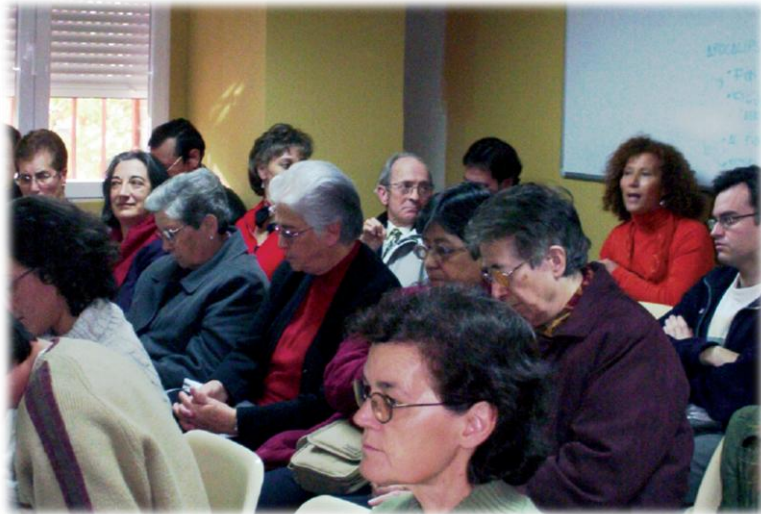
Los asistentes participaron activamente con sus preguntas.

Existe una proporción importante de padres, entre los que manifiestan conductas de maltrato hacia sus hijos, caracterizados por su inmadurez y su juventud. La juventud de los padres, puede convertirse en un impedimento, para poder atender de forma adecuada las necesidades de los menores. La falta de preparación y su