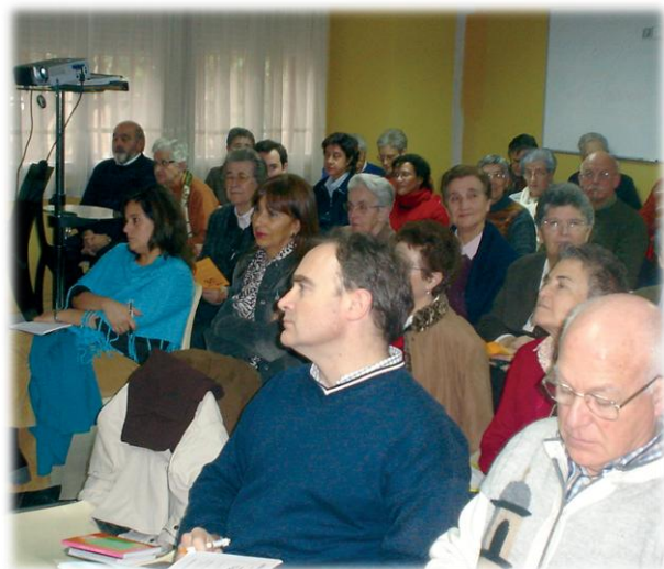
Los asistentes siguieron con atención las ponencias.

En España, tanto inmigrantes regulares como irregulares, son titulares de los derechos a la educación y la sanidad gratuitas así como de los derechos sociales básicos. Gozando además los regulares de un régimen de derechos sociales y económicos teóricamente equivalentes al de los españoles. Sin embargo, obstáculos, trabas y requisitos a veces visibles a veces invisibles vulneran derechos fundamentales de los inmigrantes regulares como el de poderse agrupar con los suyos, el del derecho a la intimidad de los datos personales, el de la posibilidad de cambiar de sector laboral fácilmente 4 .