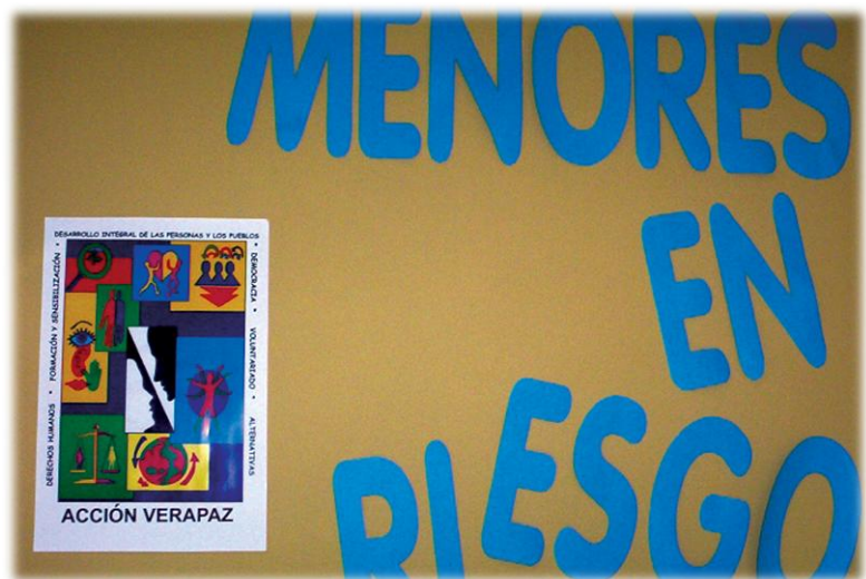
Cartel del V Encuentro.

Así, el modelo ecológico asume que la familia está influenciada por el contexto social en el que se halla inmersa. La familia como ecosistema se encuentra en interacción con su entorno (el vecindario o el sistema social), de forma que los cambios que se pueden producir en el exterior, junto con los cambios que se producen en el entorno familiar, pueden generar