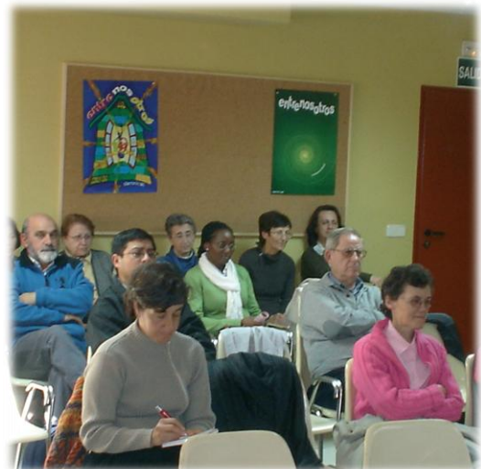
Los asistentes no perdieron detalle de las ponencias.