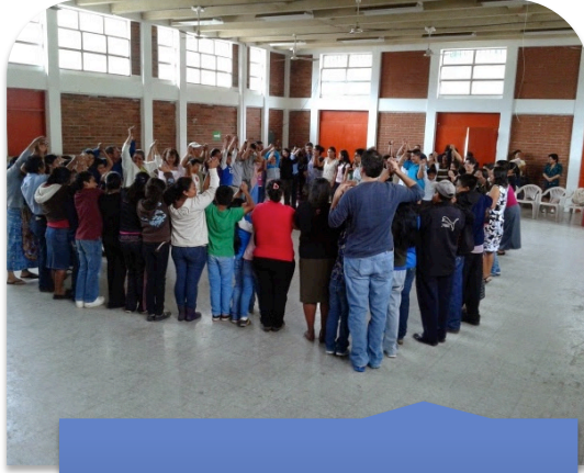
Taller: "Derechos Humanos"