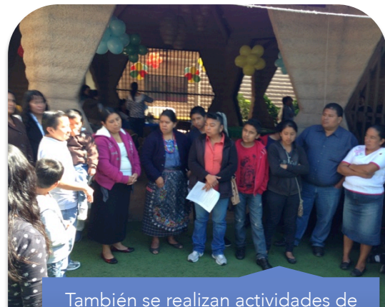
También se realizan actividades de reflexión por todo lo aprendido y se da un reconocimiento a los voluntarios.