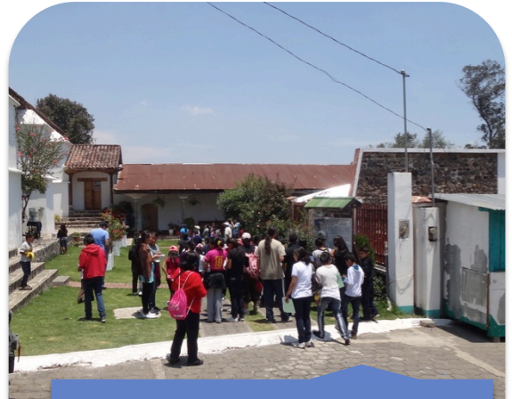
Aprendiendo sobre el proyecto de reciclaje que se maneja en el Municipio de San José Chacayá, Sololá.