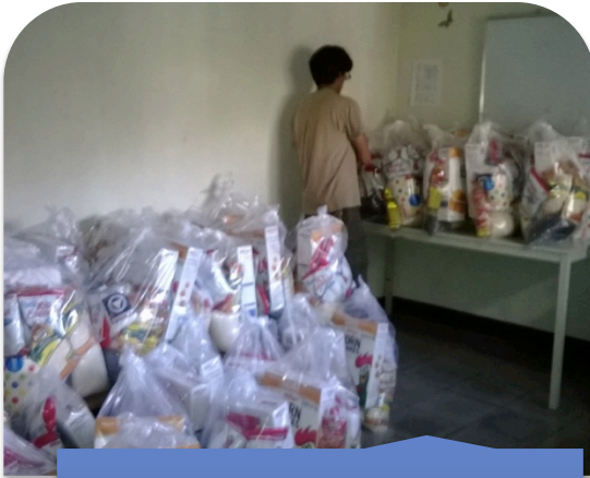
Trabajo de recepción y organización de la CBA.