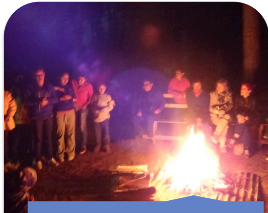
Fogata en el Parque Ecológico Corazón del Bosque.