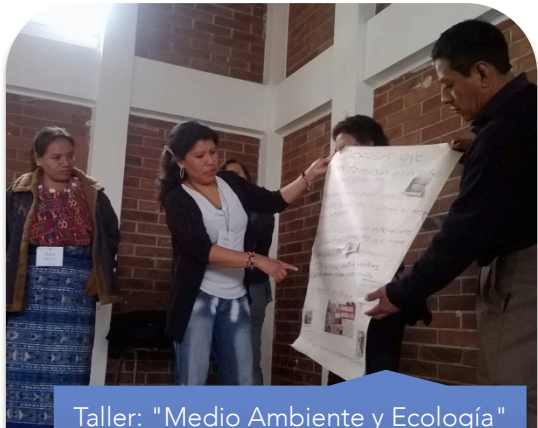
Taller: "Medio Ambiente y Ecología" la participación de los padres y Madres de Familia se ha dado en un ambiente de confianza y respeto.