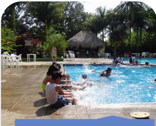
Baño en las piscinas de Auto Safari Chapín.