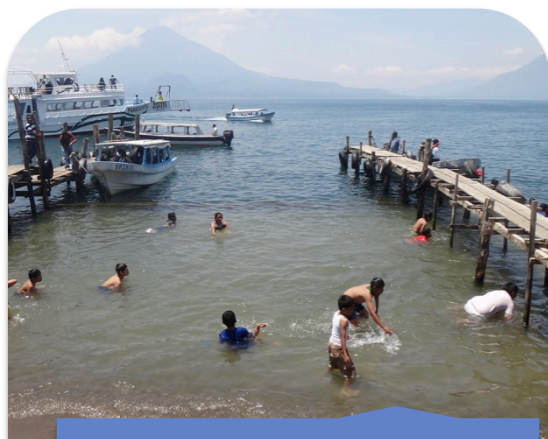
Baño en las aguas del Lago de Atitlán, Sololá.