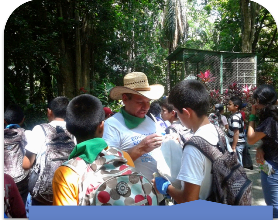
Excursión Auto Safari Chapín, octubre 2014.