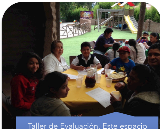
Taller de Evaluación. Este espacio permite una convivencia entre todos los voluntarios y beneficiados del proyecto.