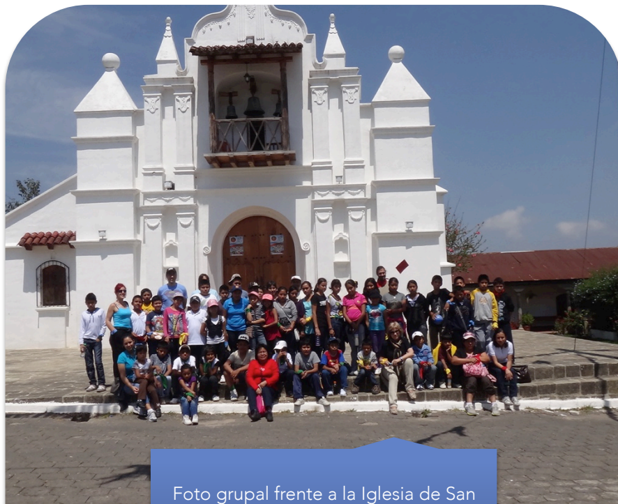
Foto grupal frente a la Iglesia de San José Chacayá.