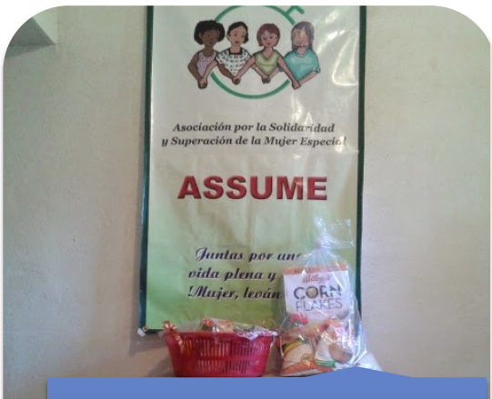
Canasta entregada en diciembre.