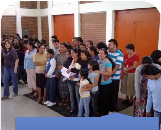
Taller: "Técnicas para la Buena Comunicación"