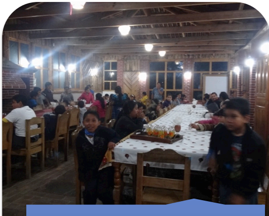
Cenando en el Restaurante del Parque Ecológico Corazón del Bosque.