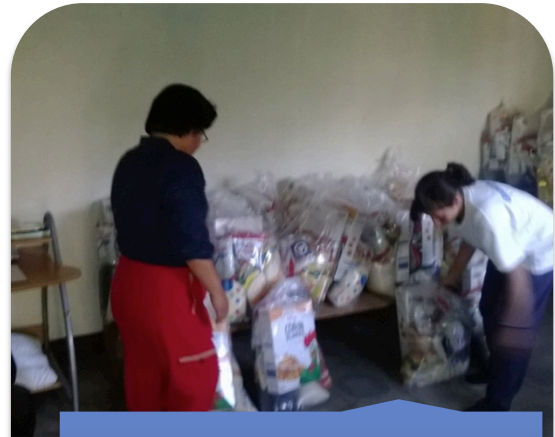
Trabajo de recepción y organización de la CBA.