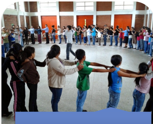
Taller: "Derechos Humanos"