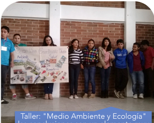
Taller: "Medio Ambiente y Ecología" las conclusiones son un elemento muy importante dentro de cada taller, un aporte muy valioso de cada participante, adulto o niño.