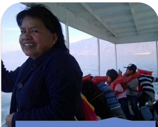
Recorrido en lancha en el Lago de Atitlán, Sololá.