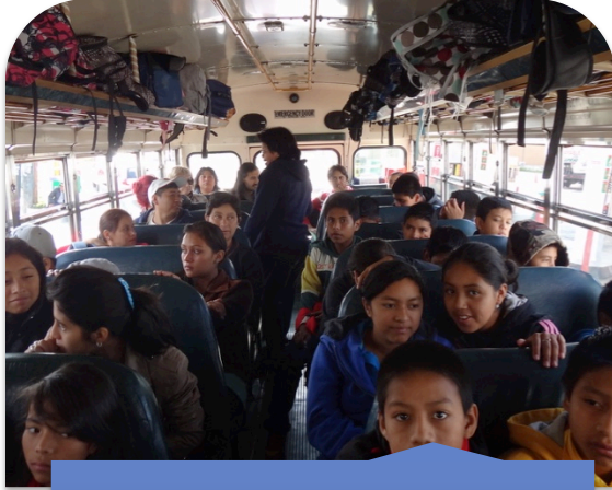
Iniciando el viaje hacia Sololá.