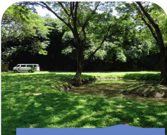
Recorrido en vehículo. Auto Safari Chapín.