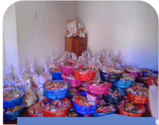
Canasta entregada en diciembre con algunos productos navideños.