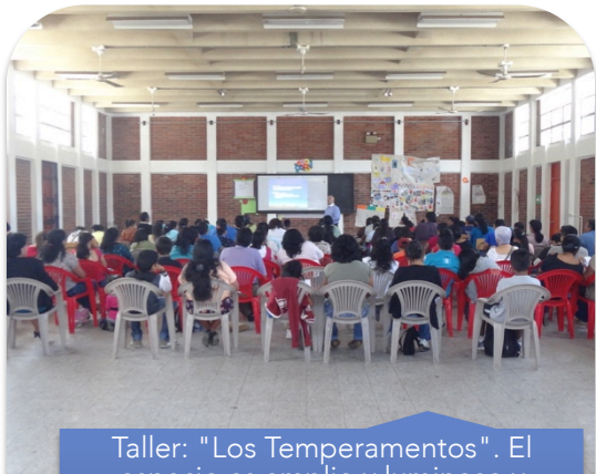
Taller: "Los Temperamentos". El espacio es amplio y luminoso y permite albergar hasta 110 personas, cuando se hace la invitación a algunos niños.