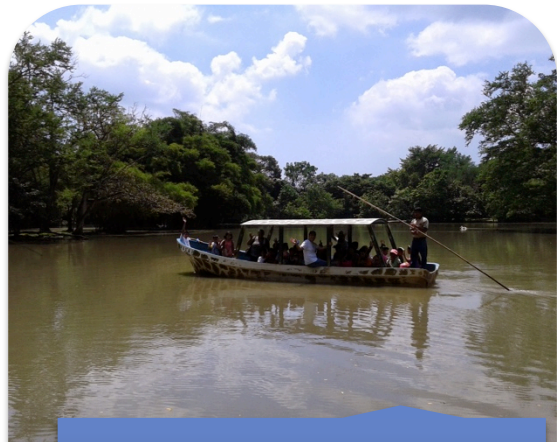
Recorrido en lancha en Auto Safari Chapín.