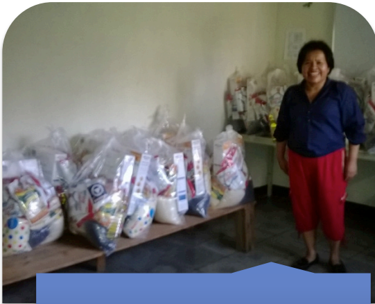
Canasta Básica de Alimentos.