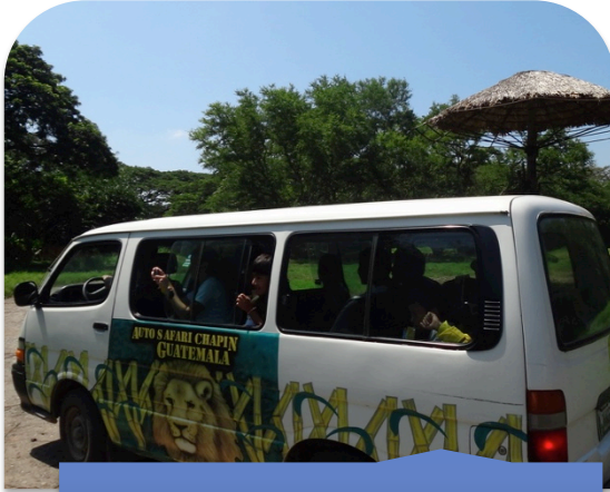
Visita a Auto Safari Chapín, ubicado en el Km 87 1/2 Carretera a Taxisco.