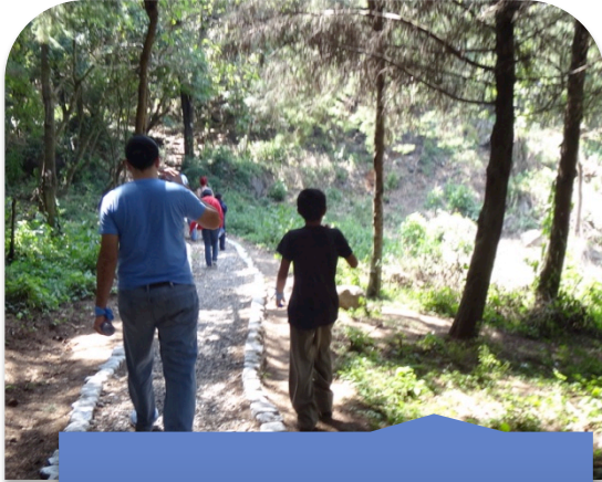
En el Sendero de la Campana, San José Chacayá, Sololá.