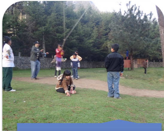
Jugando al aire libre en Parque Ecológico Corazón del Bosque.