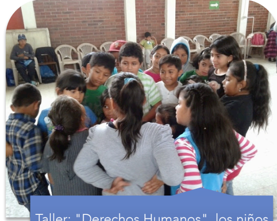
Taller: "Derechos Humanos", los niños poniéndose de acuerdo para realizar una representación.