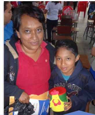
Tarea dejada en el taller "Finanzas Saludables", alcancías de ahorro.