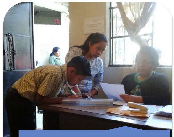
Control en la entrega de la Canasta Básica de Alimentos.