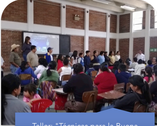
Taller: "Técnicas para la Buena Comunicación", un taller impartido con mucho dinamismo y alegría.