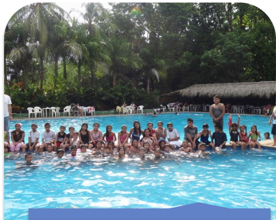
Foto grupal en área de piscinas, Auto Safari Chapín.