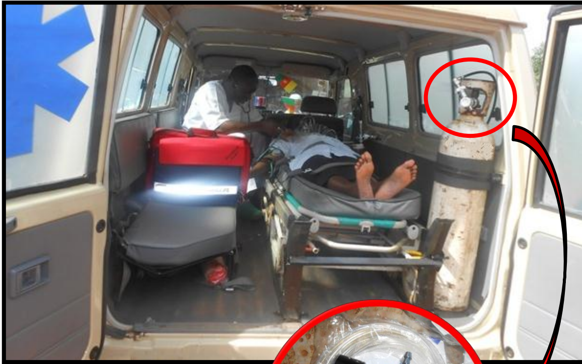
Sistema fijo con manómetro