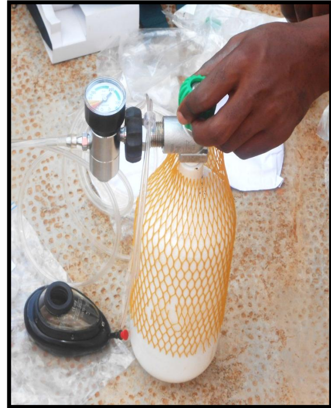
Sistema portátil con conexión a ambú