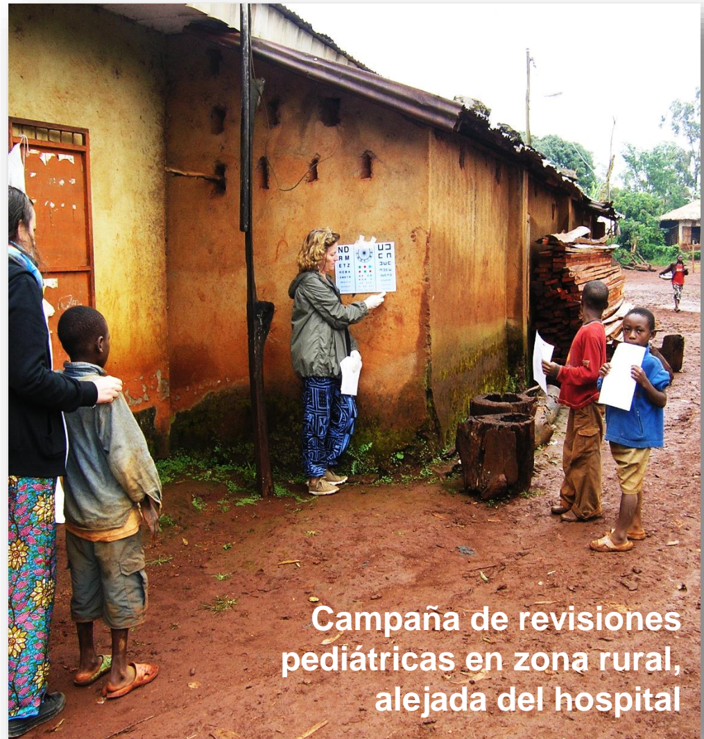
Campaña de revisiones pediátricas en zona rural, alejada del hospital